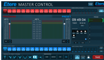
(ETERE MASTER CONTROL)